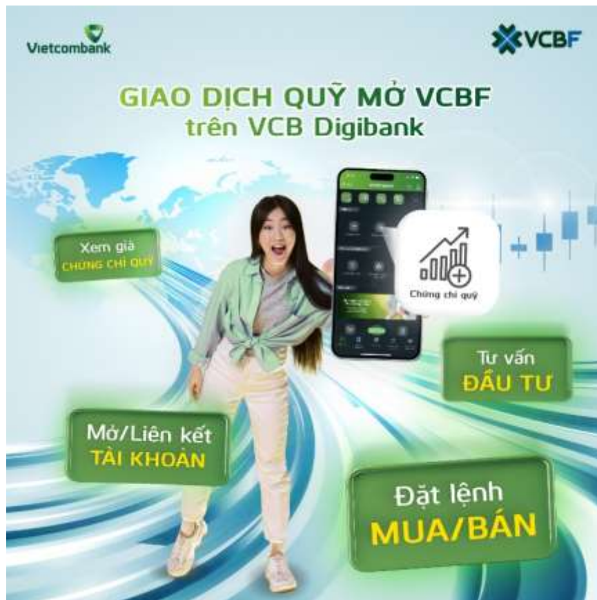
Giao dịch quỹ mở VCBF dễ dàng trên ứng dụng VCB Digibank

Nhằm nâng cao trải nghiệm của khách hàng, VCBF phối hợp với Vietcombank tiếp tục nâng cấp với những tính năng mới, thuận tiện hơn trong giao dịch gồm có: