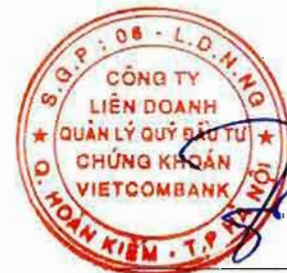
Biên Sự Tân Phó Tổng Giám Đốc