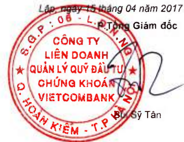
B. Sỹ Tân